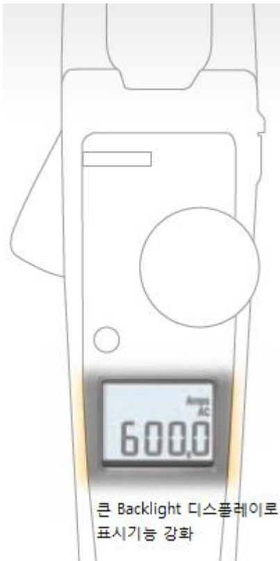
큰 Backlight 디스플레이로 표시기능 강화