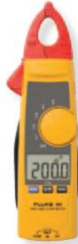
소형의 분리가능한 Jaw