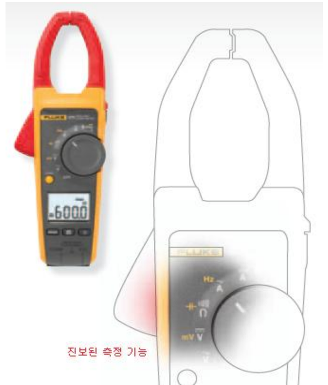
진보된 측정 기능