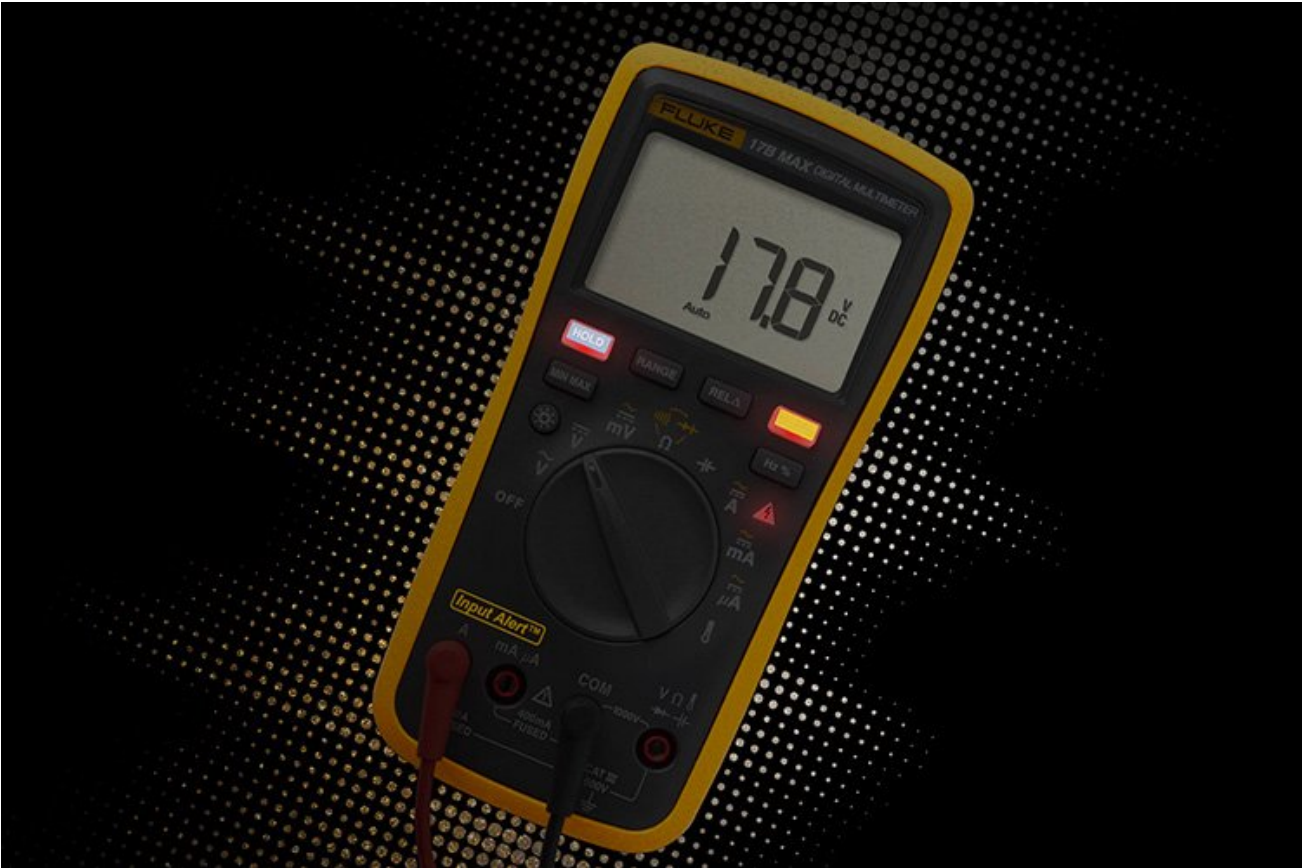
퓨즈 손상을 줄이기 위해 오작동(결선)에 대한 알람 및 시각적 경보 제공