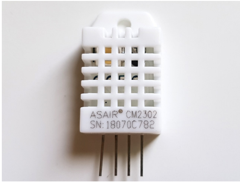
(온습도센서 CM2302 + USB232-RHT 모듈 + USB232-TTL )