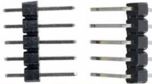
동봉된 접속 핀